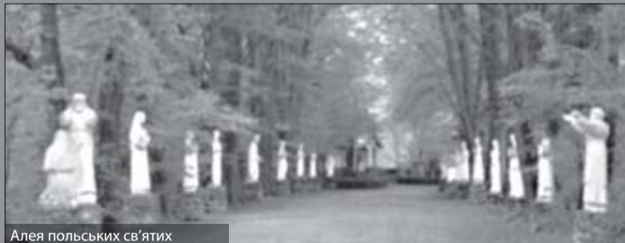
Алея польських свят