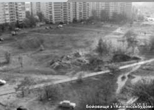
Бойовище з «Київміськбудом»