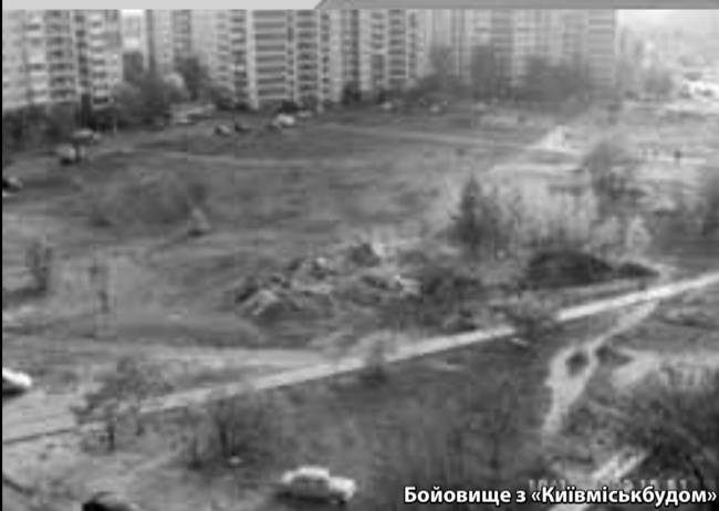
Бойовище з «Київміськбудом»